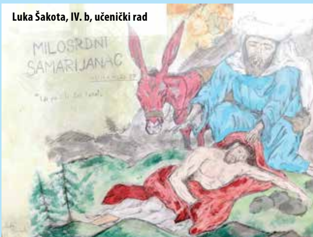
Luka Šakota, IV. b, učenički rad