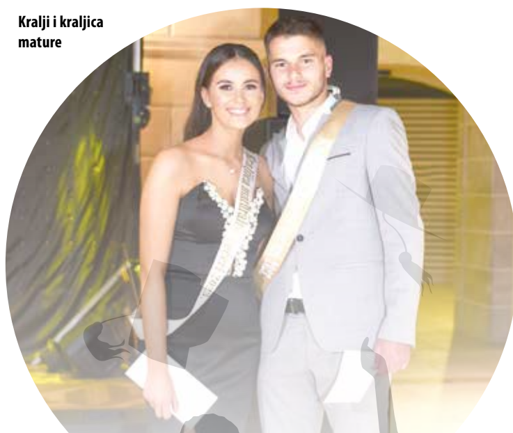
Kralji i kraljica mature